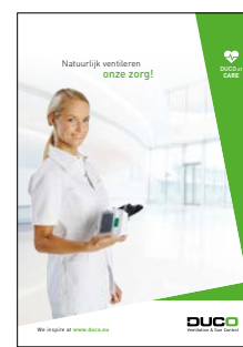
DUCO at CARE

bel +32 58 33 00 33 of mail naar info@duco.eu