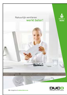
DUCO at WORK

Ontdek onze andere concepten in deze brochures: