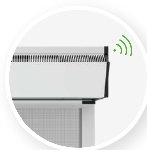
Option : TronicTwin 120