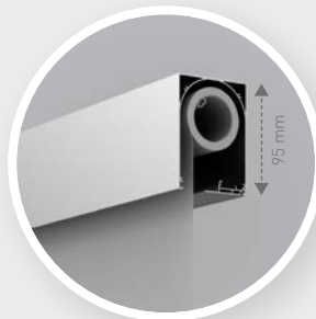
DucoScreen Front 95 Dimensions compactes de caisson