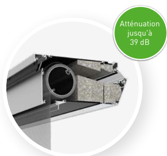
Standard avec mousse amortissante