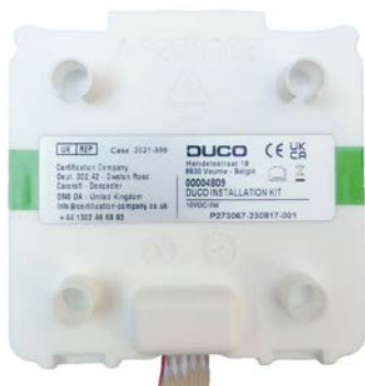
Duco Kit d'Installation

Le numéro de série figure également sur la pièce DUCO elle-même.