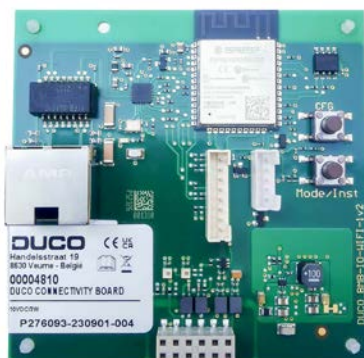
Duco Connectivity Board